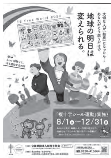
2023年度複十字シール運動ポスター