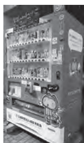
寄付型自動販売機