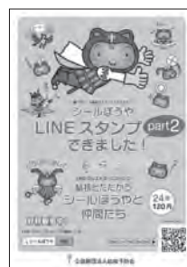
LINEスタンプ 様々な募金方法