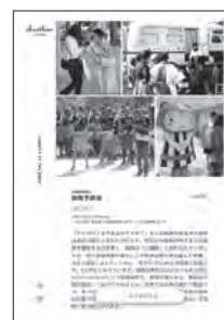
チャリボン (古本募金)