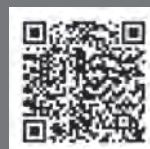
結核予防会ホームページ

公益財団法人 結核予防会事業部募金推進課 フリーダイヤル 0120-416864