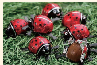
しあわせを運ぶてんとう虫チョコ