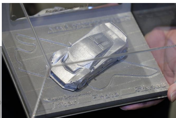
見事にデザインを再現