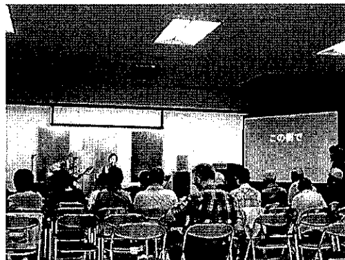
市辺コミセン 歌声喫茶