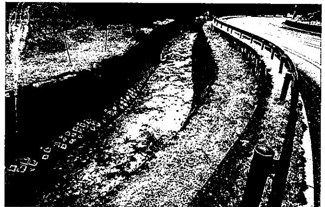
桃谷川河川敷 整備後