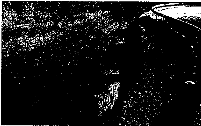
桃谷川河川敷 整備前