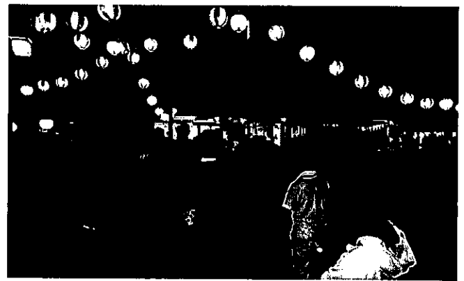
田代高原の郷 夏祭り 令和元年8月17日