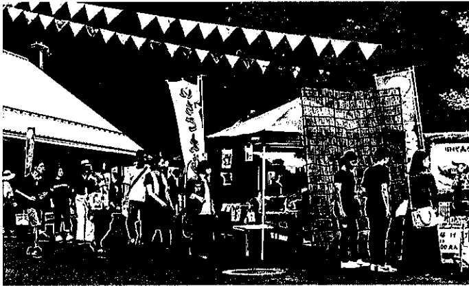
ももだにオーガニックマルシェ 1