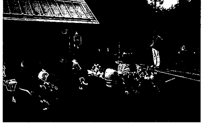
田代高原の郷 夏祭り 2