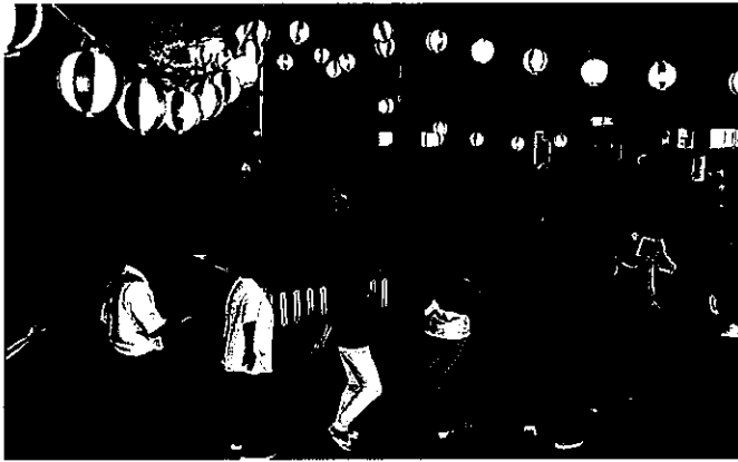
田代高原の郷 夏祭り 1