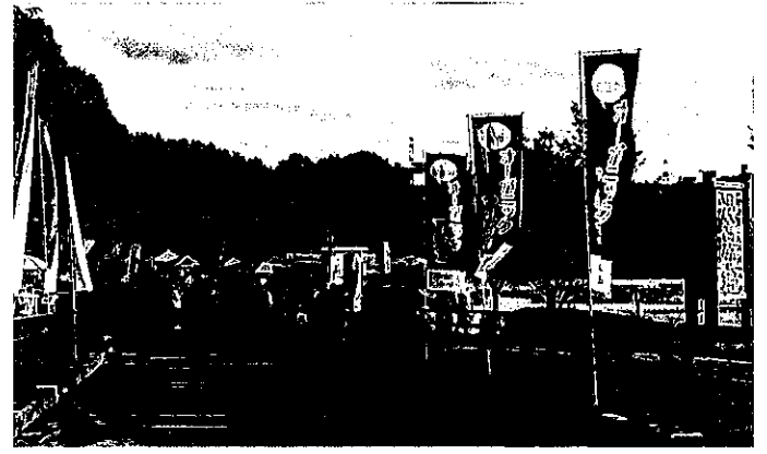
ももだにオーガニックマルシェ 2