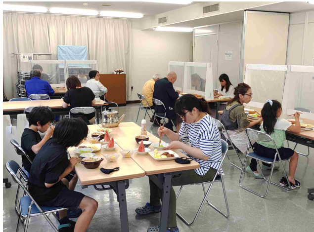
かめのこ子ども食堂