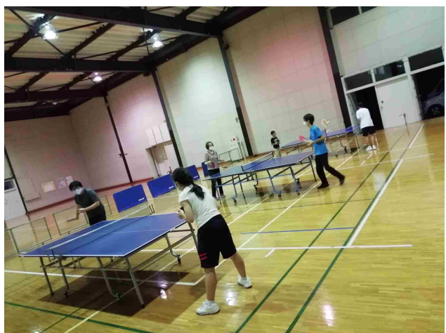
スポーツフライデーナイト