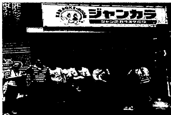
エンジョイクラブ