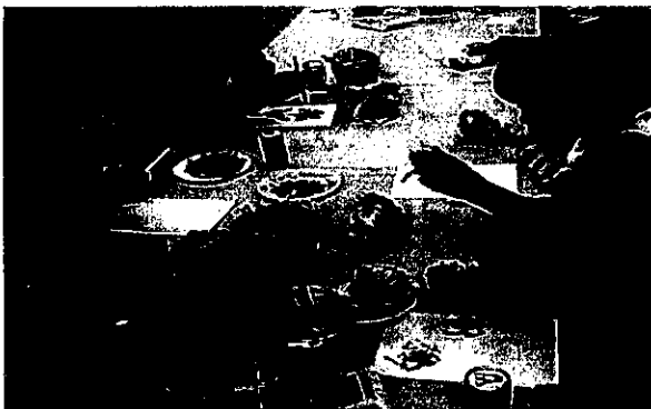
ゲイジユツあそび教室