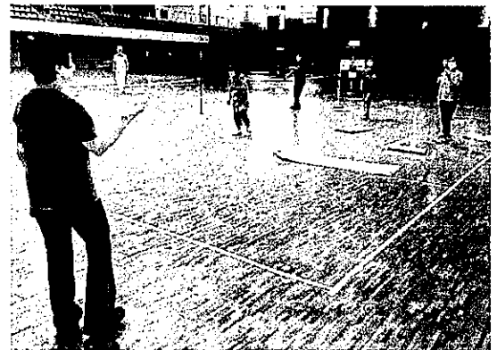
ほほえみ健康スポーツ大学