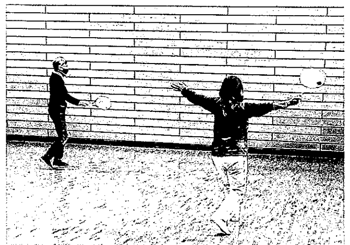
太極柔力球(ロウリーボール)