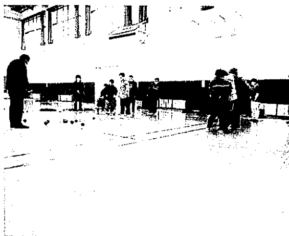
ポッチャ交流会(令和5年1月14日)