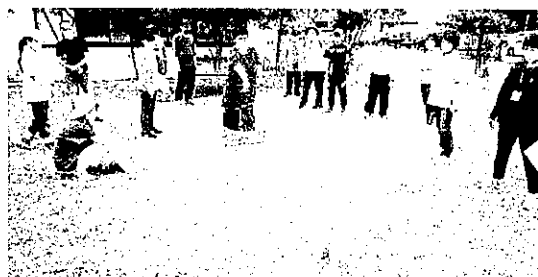
ニュースポーツ体験会(モルック)(令和4年6月11日)