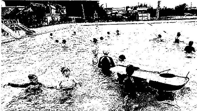
スポーツサタデー(プール)