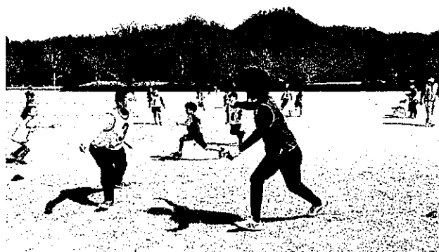
ほほえみスポーツ鬼ごっこ交流会