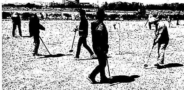
グラウンド・ゴルフのつどい