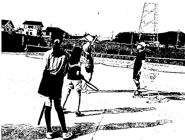
テニススクール(ジュニア)