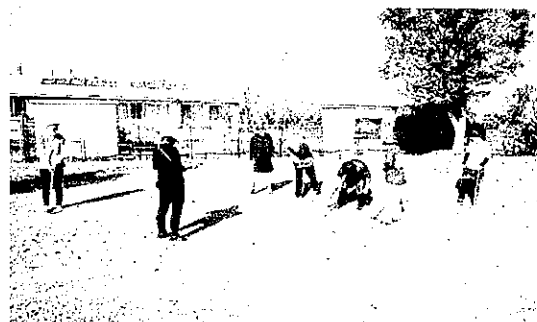
秋季グラウンド・ゴルフ交流会(令和4年11月12日)