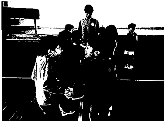
キッズ・スポーツ(スポーツ鬼ごっこ)