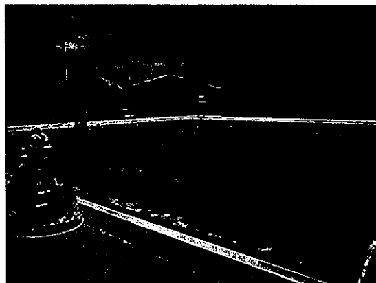
スポーツサタデー(プール)