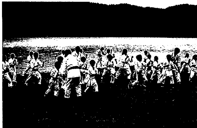
野洲市空手道クラブ