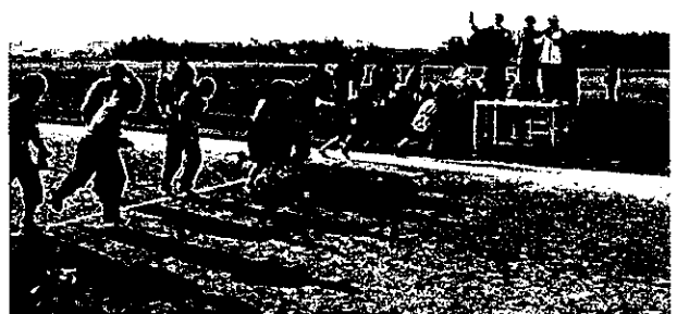
第6回びわ湖若鮎駅伝大会