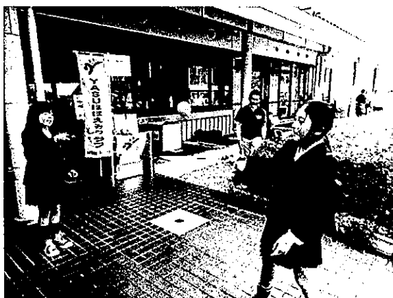
コミセンみかみクラブ活動出展