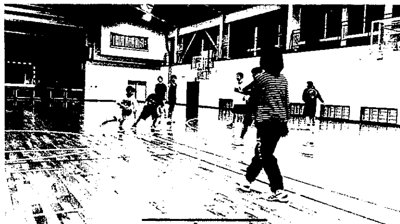
バスケットボール