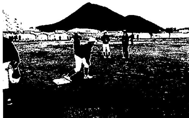
野洲ブレイブス & 滋賀マイティエンジェルス