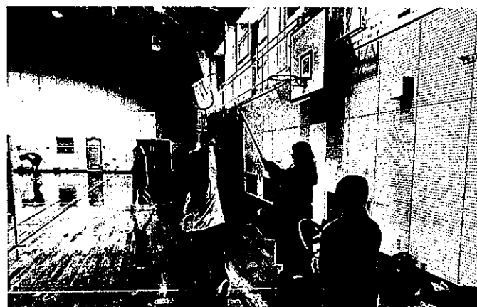
バドミントンスクール