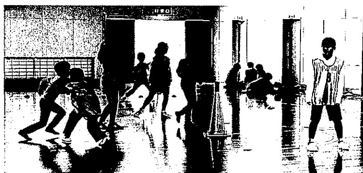
キッズ・スポーツ(スポーツ鬼ごっこ)