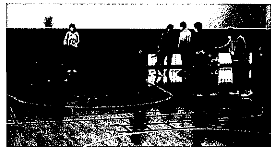
なかよし交流館で遊ぼう!