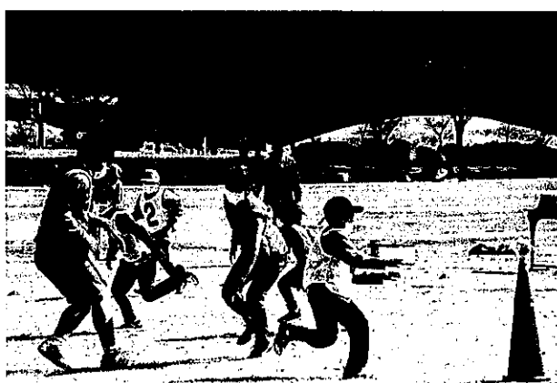
ほほえみスポーツ鬼ごっこ交流会