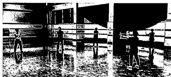
太極柔力球(ロウリーボール)