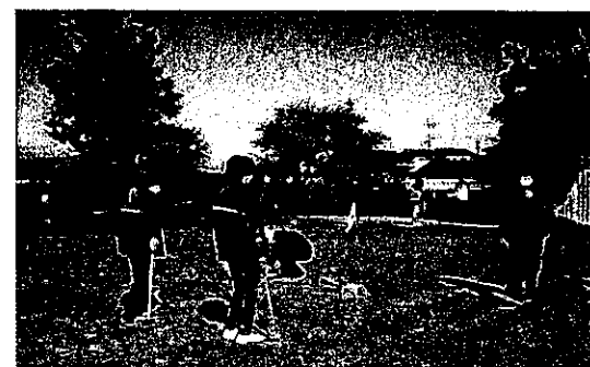
秋季グラウンド・ゴルフ交流会