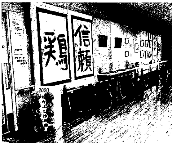
野洲の風に集う(なかよし作品展)