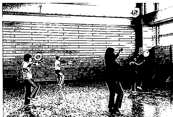
太極柔力球(ロウリーボール)