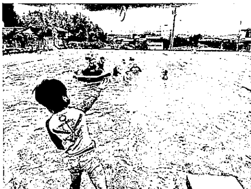
スポーツサタデー(プール)