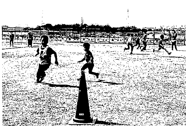
ほほえみスポーツ鬼ごっこ体験会