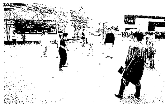
春季グラウンド・ゴルフ交流会(令和3年5月8日)