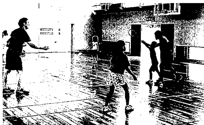
キッズ・スポーツ(バドミントン)

内容:小学生から中学生の年代を主対象にした幅広いスクール。少年団やバレー部の子どもも参加している。