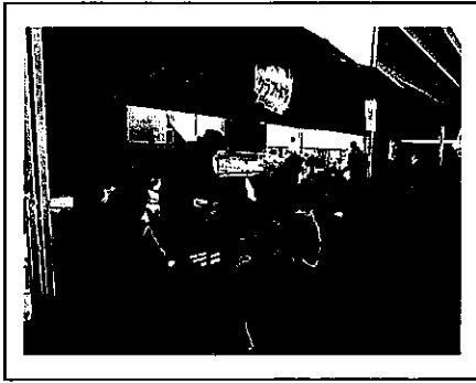
南笠東合同フェスタ