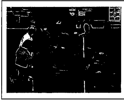
山田ふれあいまつり